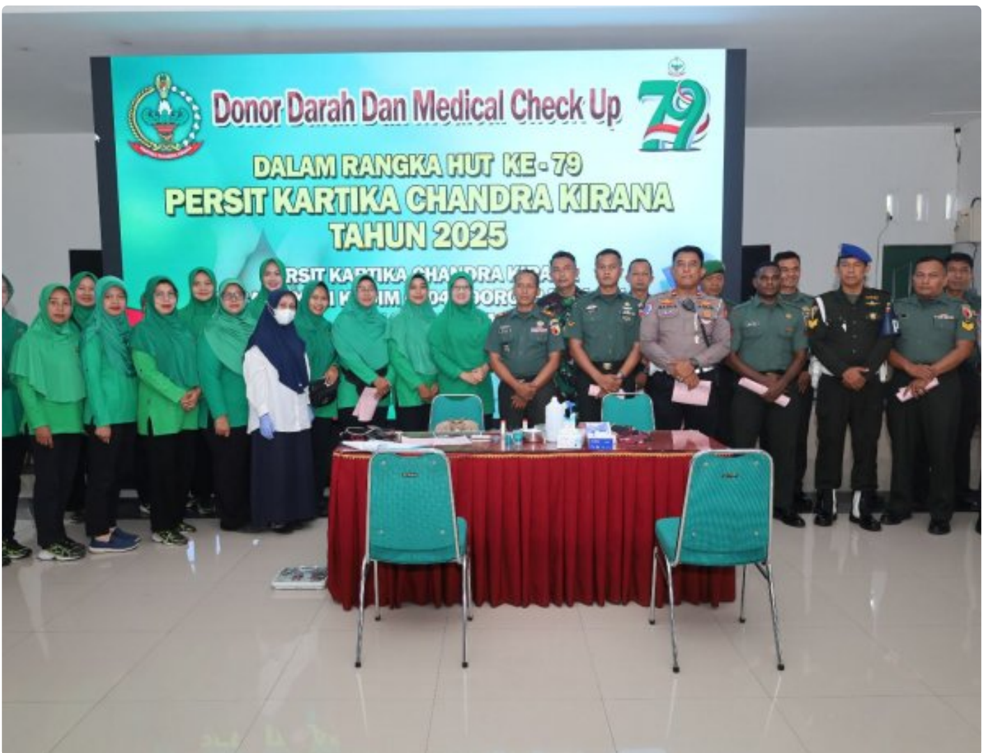
Persit KCK Kodim 0804/Magetan Gelar Donor Darah dan Medical Check Up Peringati HUT ke-79

Magetan - Persit Kartika Chandra Kirana ( KCK ) Cabang XVIII Kodim 0804/Magetan menggelar kegiatan sosial donor darah dan medical check-up, dalam rangka memperingati HUT ke-79 Persit Kartika Chandra Kirana. Acara