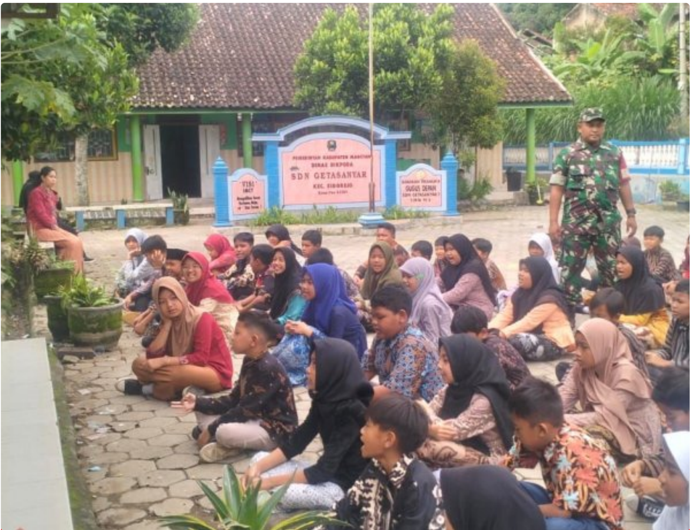
Kedisiplinan Kunci Kesuksesan, Bati Komsos Posramil Sidorejo Melatih PBB dan WASBANG Siswa SDN 1 Getasanyar

Magetan. - Bati Komsos Posramil Sidorejo Koramil Tipe B 0804/02 Plaosan Serma sadino bersama Babinsa memberikan pelatihan peraturan Baris Berbaris (PBB) dan wasbang kepada siswa-siswi SDN 1 Getasanyar Kecamatan Sidorejo